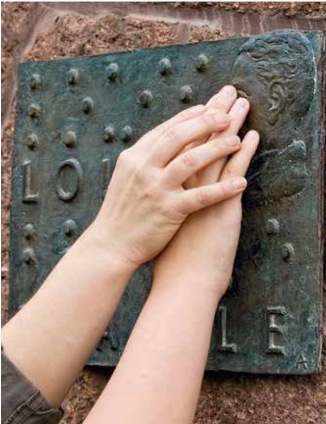
Louis Braille - Gedenktafel am BFW Halle

klären. Der beratende Mitarbeiter aus dem BFW Halle (Saale) kennt unzählige Werdegänge und erfolgreiche Rehabilitationsverläufe von ehemaligen Teilnehmern im BFW Halle (Saale) und schöpft aus dieser Erfahrung. Sie können sich sicher sein, dass er seine Erfahrung sehr gern an Sie weitergibt.