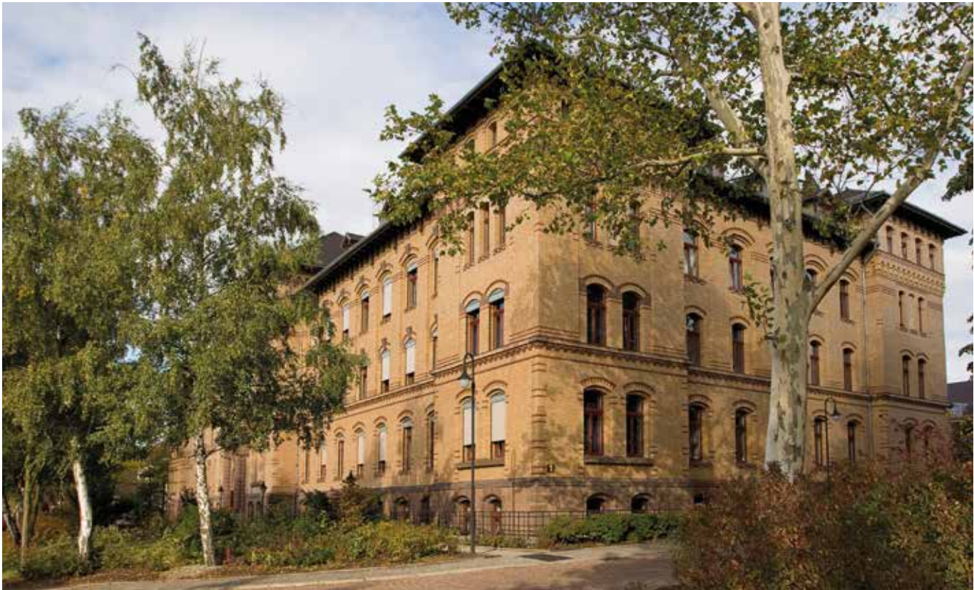
Berufsförderungswerk Halle gGmbH - Das Kompetenzzentrum "Rund um das Sehen" in den neuen Bundesländern

Wenn Sie gerne Gesetzestexte lesen, sich im Internet und in der einschlägigen Literatur umfassend informieren, Ihren zuständigen Berater bei Ihrem Rehabilitationsträger kennen und kontaktieren und wenn Ihnen 100 prozentig klar ist wie es beruflich mit Ihnen weitergeht – legen Sie diese Broschüre einfach zur Seite und beginnen am besten gleich mit