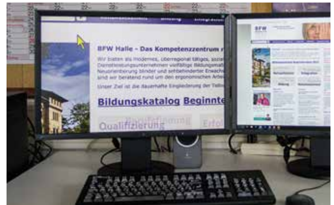
BFW Halle (Saale) - Bereich Elektronische Hilfsmittel Vergrößerungssoftware an einem Arbeitsplatz mit Zweischirmlösung

Die Standorte der Geschäfts- und Beratungsstellen des BFW Halle (Saale) fin-